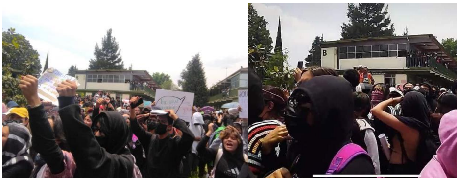
Martínez G.F (2023), Paro prepa dos , [fotografía con derecho propio]

La anterior administración estaba a punto de llegar a su término, y también el semestre 2023A estaba por concluir, se acercaban los exámenes y el periodo electoral. De pronto, los alumnos empezaron a organizarse, no puede afirmarse que, instigados por alguien, pero había rumores, y de pronto, como un rayo caído en el centro de la prepa, los alumnos se reunieron frente al edificio administrativo del plantel y empezaron a corear ¡Paro! ¡Paro! ¡Paro!