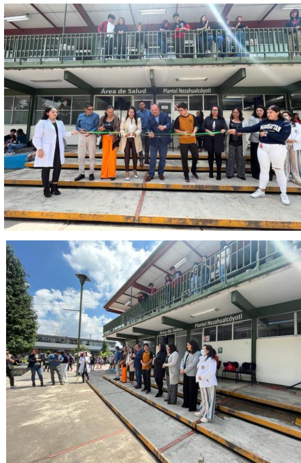
(2023), Primera feria de servicios a los estudiantes , archivo del plantel. [fotografía con derecho propio].

También Se inauguró la Primera Feria de Servicios al estudiante de nuestro plantel, en la cual vinieron emprendedores, básicamente, microempresas a ofrecer productos y a dar pláticas al respecto. Se inauguró el 19 de septiembre.