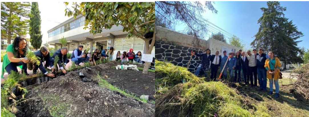
(2023), Rehabilitación de las áreas verdes , archivo del plantel. [fotografía con derecho propio].

También se han gestionado apoyos externos, uno de ellos fue con el diputado local del distrito XXXIV de Toluca, Gerardo Lamas, quien donó material bibliográfico a los alumnos, al igual que material impermeabilizante para mejorar las instalaciones, lo cual se entregó en el plantel el 14 de septiembre de 2023.