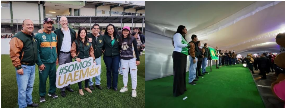
(2023), Entrega de la cancha de fútbol rápido y develación de la placa conmemorativa por el 50 aniversario de la Rondalla Nezahualcóyotl , archivo del plantel. [fotografía con derecho propio].

parece si después de la entrega se realiza una especie de Kermes con DJ y que haya baile? Propongánselo a Erick, no le digan que yo se los sugerí, pero sí díganle que acepto la invitación y que allá estaré el diez de noviembre”. Y todo el turno vespertino quedó fascinado cuando se realizó.