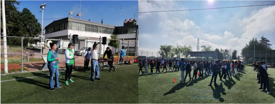
(2022), Bienvenida a la generación 2023-2026 , archivo del plantel. [fotografía con derecho propio].

Un aspecto muy importante y que es de interés de la Rectoría es el cuidado del medio ambiente, de tal suerte que se realizó una campaña de rehabilitación de las áreas verdes, en coordinación con la Dirección de Protección al Ambiente de nuestra Universidad, Esto tuvo lugar el 30 de agosto, varios alumnos participaron activamente y queremos seguir siendo una escuela donde prevalezca el verde, no sólo como color identitario, sino que se conserven las áreas verdes.