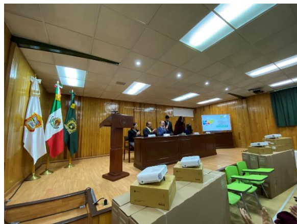
(2023), Entrega de pantallas, proyectores y butacas por el Dr. Carlos Eduardo Barrera Díaz, Rector de la UAEMEX, archivo del plantel. [fotografía con derecho propio].

Como iniciaba un nuevo ciclo escolar, el 20 de agosto se les dio la bienvenida a los alumnos de nuevo ingreso, generación 2023-2026, por parte del plantel, que consistió en una mañana deportiva, instrumentando diversos juegos y competencias, al final se les ofrecieron bocadillos y los jóvenes convivieron y departieron alegremente.