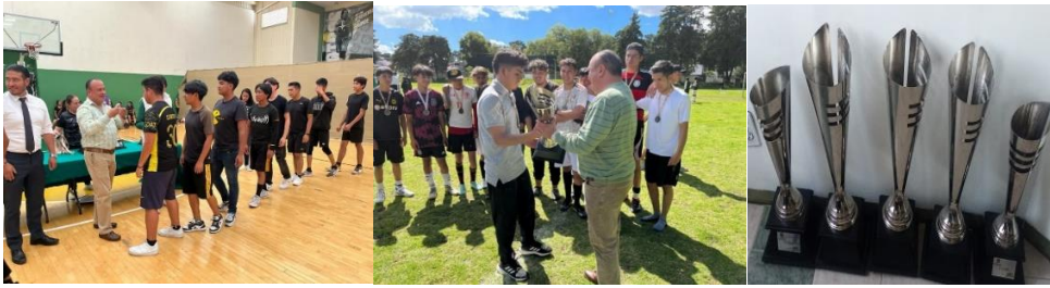
(2023), Premiaciones , archivo del plantel. [fotografía con derecho propio].

Lo artístico es otro aspecto importante para nuestro plantel, de tal manera que se dio a conocer la obra del maestro José Manuel Talavera, docente del plantel y pintor destacado, quien tuvo a bien montar en el pasillo del edificio administrativo la exposición pictórica denominada Subjetividades , que fue inaugurada el 24 de octubre de 2023.